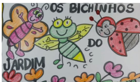
OS BICHINHOS DO JARDIM